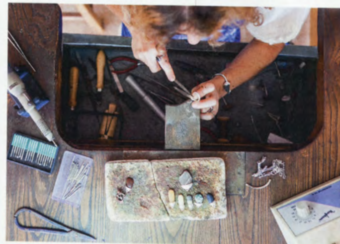
las piedras tienen sus características. En la de Ogeia, en Bizkaia, descubrí que la mayoría tenían tonos agranados" explica.